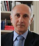
Patrick ROSSI Sous-directeur du droit économique au sein de la direction des affaires civiles et du sceau – Ministère de la justice